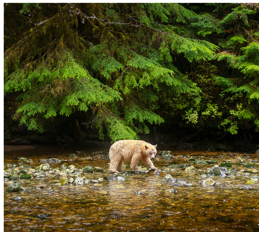
贝索斯地球基金所提供的资金将帮助确保对加拿大不列颠哥伦比亚省25万英亩的原始森林——白灵熊等野生动物栖息地进行长期保护，并为整个Emerald Edge地区的气候工作提供支持。

解决方案： 与土著居民合作保护沿岸的雨林是对土著居民主导的雨林管理愿景的尊重，同时也保护了森林这一碳库。