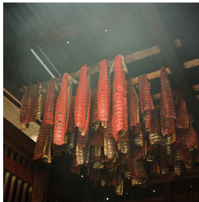
(布里斯托尔湾)；(亚马孙)

采摘可可果实制作巧克力有助于为亚马孙雨林的重新造林提供支持，并且能够为小规模农户带来稳定收入。